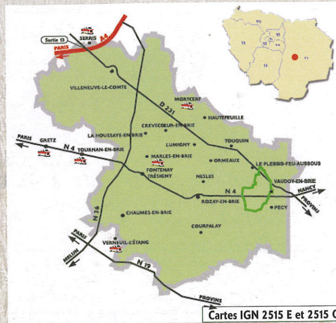
Cartes IGN 2515 E et 2515 O

L'église du village de Planoy, hameau de la commune de Voinsles, était dédiée à Saint Leu et Saint Gilles. Il ne reste aujourd'hui à planoy que quelques maisons et une grande ferme.